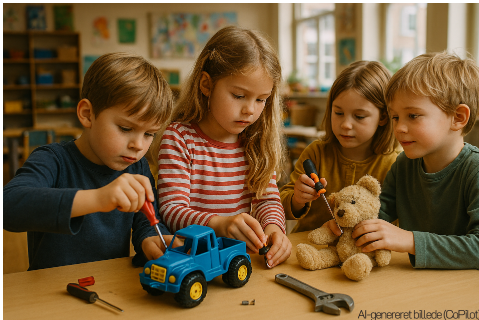
AI-genereret billede (CoPilot)

Det færdige produkt placeres et synligt sted på skolen, i SFO'en, i klubben eller i lokalområdet. En lille forklaring eller et foto deles med forældre og kan sendes videre til den fælles fortælling .